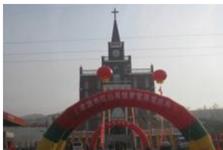
Hongshan kirke Liaoning

Statistikker om hvor mange nye kirker der bygges varierer helt afhængig af, hvem man spørger. Det mest populære svar er, at der bygges en kirke om dagen og at 1 mil. kinesere bliver døbt om året. Men da der ikke findes officielle statistikker, bl.a. fordi mange af kirkerne ikke er registrerede kan vi nøjes med at konstatere, at der bygges mange kirker og at der er stor vækst i kirken. Derfor skal vi også have et par eksempler på kirker der netop er indviet.