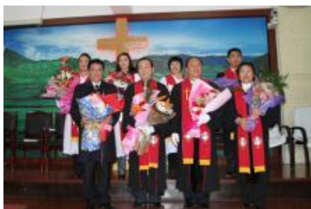
Ordination af 4 præster i Anshan