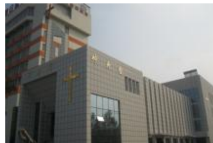
Zhangdian distriktet Kirke