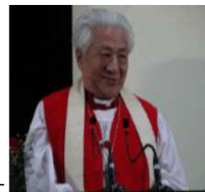
Bishop K.H. Ding