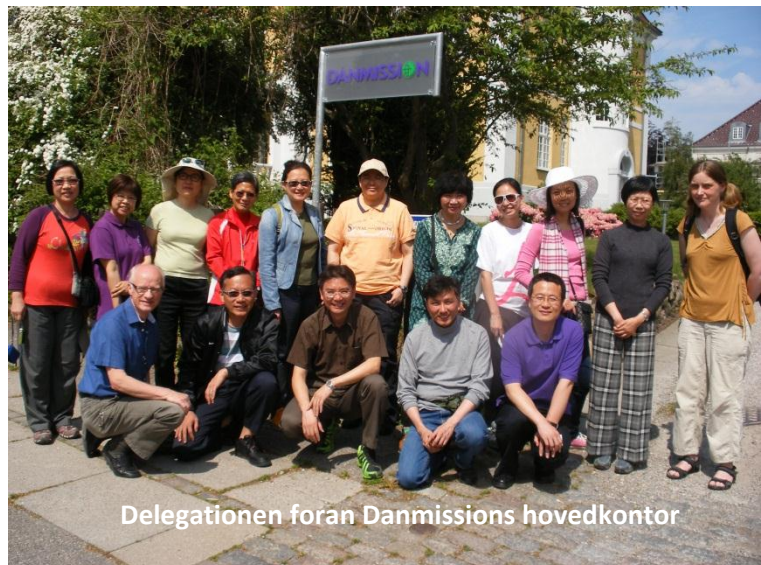
Delegationen foran Danmissions hovedkontor

I 100 år har missionærer og andre fra Buddhistmissionen/Areopagos rejst til Asien for dér at være i mission. Og de sidste 20-30 år har adskillige rejsegrupper af missionens venner været på besøg i Hong Kong. Men der har aldrig været en gruppe af frivillige fra Asien på genbesøg i Danmark og Norge. Denne envejstrafik er der nu ændret på, idet 16 dejlige Hong Kong-kinesere var på besøg i Danmark 19-30. maj. Vi var i første omgang blevet lovet en gruppe modne teenagere eller helt unge. For at nedbringe udgifterne ved turen havde vi derfor arrangeret privat indkvartering hos medlemmer af